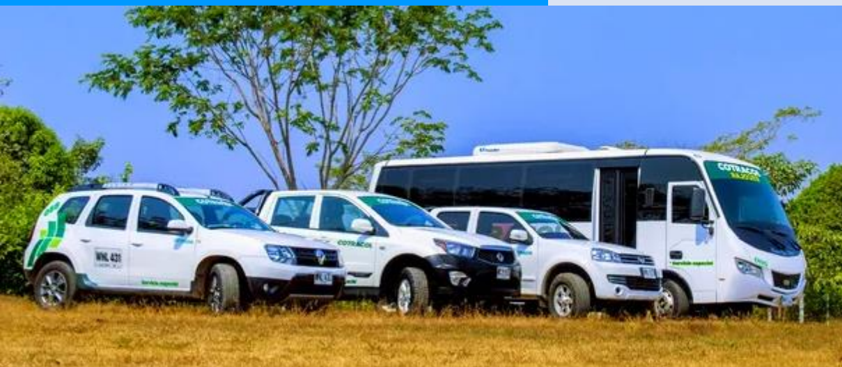
Transporte Especial y transporte Escolar